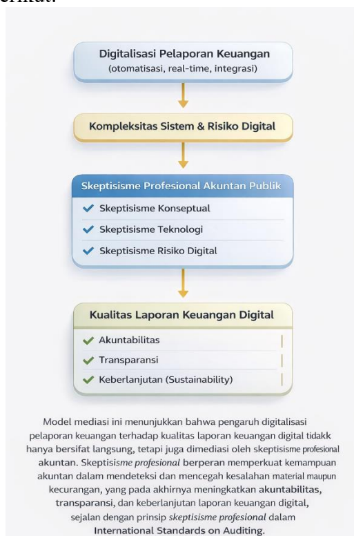
Gambar 2. Model Mediasi Digitalisasi Laporan Keuangan

Dengan demikian, standar audit internasional perlu dipahami dan diimplementasikan secara lebih kontekstual dalam menghadapi transformasi digital pelaporan keuangan, tanpa mengurangi prinsip kehati-hatian dan pertimbangan profesional auditor. Dalam hal ini, maka dapat digambarkan sebagai berikut: