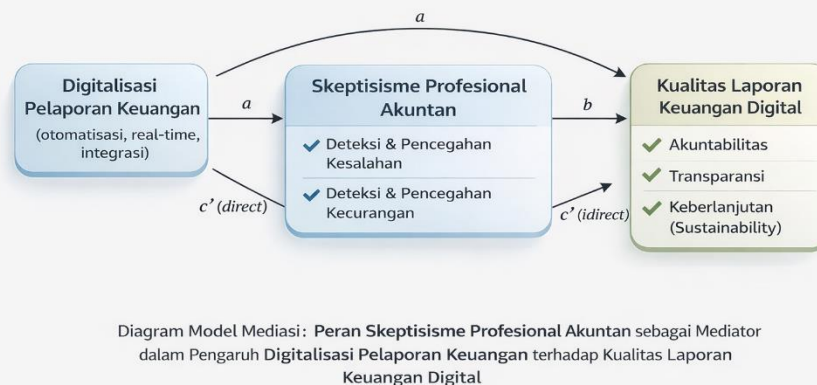
Gambar 3. Diagram Model Mediasi Peran Skeptisisme Profesional Akuntan

Dengan demikian, hasil penelitian ini menegaskan bahwa skeptisisme profesional akuntan merupakan faktor kunci dalam meningkatkan kualitas pengawasan dan pengendalian dalam pelaporan keuangan digital. Temuan ini memperkuat pandangan bahwa dalam era digitalisasi, peran skeptisisme profesional tidak berkurang, melainkan semakin penting untuk memastikan keandalan, integritas, dan kredibilitas laporan keuangan digital.