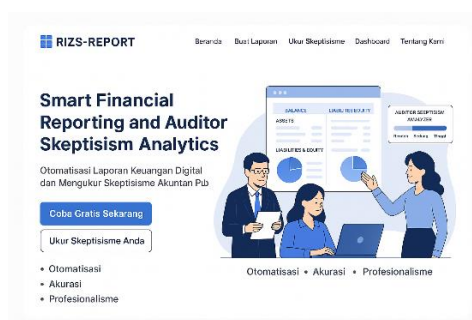
Gambar 1. Rancangan Produk Website RIZS-REPORT

Dalam hal ini dapat disimpulkan, novelty dalam pelaksanaan penelitian ini adalah produk website yang mendukung dengan pelaporan keuangan, sehingga dapat digambarkan prototype penelitian sebagai berikut: