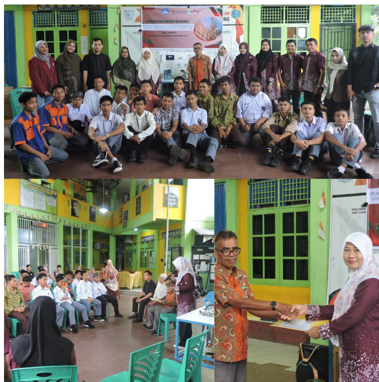
Gambar 4. Kegiatan PKM dan Serah Terima Trainer Turbin Uap kepada Pihak SMK Dhuafa Padang

Seluruh rangkaian kegiatan PKM, mulai dari demonstrasi alat hingga proses serah terima trainer PLTU, berlangsung dengan lancar dan mendapatkan perhatian penuh dari seluruh siswa dan guru SMK Dhuafa Padang. Demonstrasi alat dilakukan secara terbuka sehingga seluruh peserta dapat melihat secara langsung cara kerja sistem turbin uap dan memahami alur konversi energi yang terjadi di dalamnya. Kegiatan ini tidak hanya menjadi ajang pengenalan teknologi pembelajaran baru, tetapi juga menjadi solusi terhadap keterbatasan fasilitas praktik yang selama ini dihadapi sekolah. Serah terima trainer yang dilakukan secara resmi di hadapan siswa dan guru menunjukkan komitmen tim PKM dalam mendukung peningkatan mutu pendidikan vokasi, khususnya pada kompetensi Teknik Mesin, sebagaimana ditunjukkan pada Gambar 4. Kehadiran trainer PLTU ini diharapkan mampu memperkaya proses pembelajaran dan memberikan pengalaman praktik yang sebelumnya belum tersedia di sekolah.