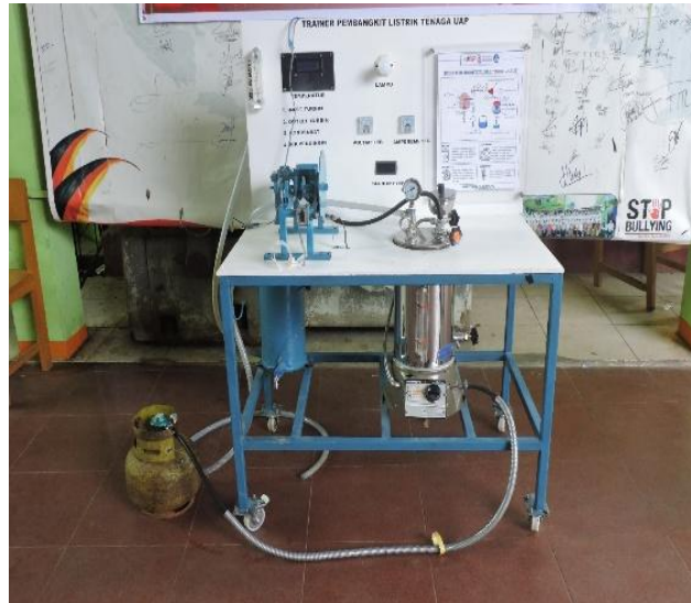
Gambar 3. Trainer Turbin Uap

Seluruh rangkaian kegiatan PKM, mulai dari demonstrasi alat hingga proses serah terima trainer PLTU, berlangsung dengan lancar dan mendapatkan perhatian penuh dari seluruh siswa dan guru SMK Dhuafa Padang. Demonstrasi alat dilakukan secara terbuka sehingga seluruh peserta dapat melihat secara langsung cara kerja sistem turbin uap dan memahami alur konversi energi yang terjadi di dalamnya. Kegiatan ini tidak hanya menjadi ajang pengenalan teknologi pembelajaran baru, tetapi juga menjadi solusi terhadap keterbatasan fasilitas praktik yang selama ini dihadapi sekolah. Serah terima trainer yang dilakukan secara resmi di hadapan siswa dan guru menunjukkan komitmen tim PKM dalam mendukung peningkatan mutu pendidikan vokasi, khususnya pada kompetensi Teknik Mesin, sebagaimana ditunjukkan pada Gambar 4. Kehadiran trainer PLTU ini diharapkan mampu memperkaya proses pembelajaran dan memberikan pengalaman praktik yang sebelumnya belum tersedia di sekolah.