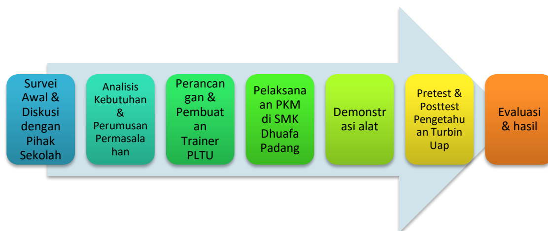
Gambar 1. Diagram alir PKM

Kegiatan pengabdian kepada masyarakat ini dilaksanakan dengan melibatkan mitra utama yaitu SMK Dhuafa Padang, khususnya pada Program Keahlian Teknik Pemesinan yang berlokasi di Kota Padang, Sumatera Barat. Mitra yang terlibat secara langsung dalam kegiatan meliputi kepala sekolah sebagai penanggung jawab institusi, guru produktif sebagai fasilitator pembelajaran, serta siswa sebagai sasaran utama program. Pelaksanaan kegiatan dirancang secara sistematis melalui beberapa tahapan yang meliputi identifikasi kebutuhan, perancangan dan pembuatan trainer, penggunaan trainer dalam pembelajaran, serta evaluasi dampak terhadap peningkatan kompetensi siswa. Seluruh rangkaian kegiatan tersebut disusun dalam suatu alur kerja terstruktur untuk memastikan ketercapaian tujuan program dan keberlanjutan pemanfaatan hasil kegiatan oleh pihak sekolah. Skema pelaksanaan program pengabdian kepada masyarakat disajikan pada Gambar 1.