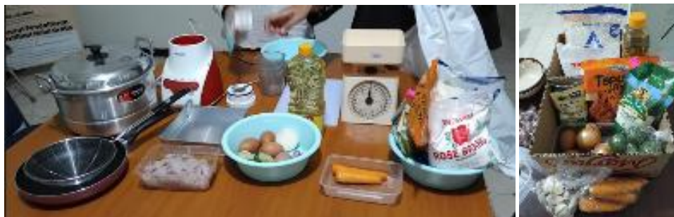
Gambar 1. Alat dan bahan pembuatan nugget ikan nila

Tahap persiapan kegiatan diawali dengan melakukan koordinasi dengan pengurus RA Ledug untuk menyepakati waktu, tempat, serta jumlah peserta kegiatan pelatihan. Selanjutnya tim pengabdian menyusun modul pelatihan yang memuat konsep dasar kewirausahaan, teknik pembuatan nugget ikan nila, higienitas dan sanitasi pangan, serta strategi pemasaran produk skala rumah tangga. Tim pengabdian juga menyiapkan bahan baku (ikan nila segar) dan peralatan pengolahan seperti: blender, panci, wajan, kompor, cetakan), serta bahan pendukung (Gambar 1).