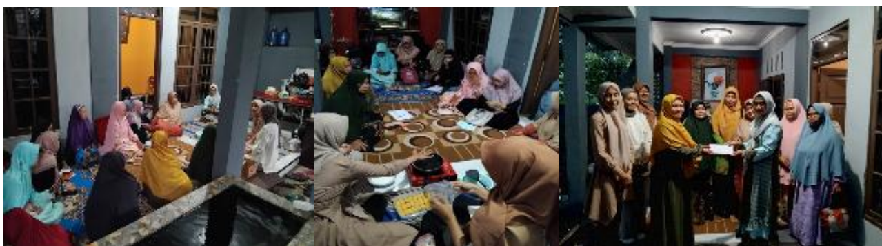
Gambar 2. Foto kegiatan pelatihan pembuatan nugget ikan nila

Praktik kedua adalah pengemasan dan labeling produk makanan. Peserta diberikan praktik sederhana pengemasan produk menggunakan kemasan food grade serta penyusunan label yang memuat nama produk, komposisi, dan tanggal produksi. Praktik selanjutnya adalah praktik perhitungan harga pokok produksi (HPP), penentuan harga jual, strategi promosi sederhana) offline dan media sosial, dan perencanaan usaha kelompok.