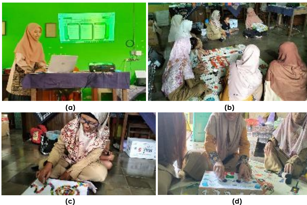
Gambar 1. Penyampaian Materi 1 Pentingnya Alat Permainan Edukatif dalam PAUD (a); Penyampaian Materi 2 Memberikan Contoh Alat Permainan Edukatif “Mengenal tekstur dan Mengenal konsep besar dan kecil” (b); Materi 3 Peserta membuat Alat Permainan Edukatif sesuai kreativitas (c); Peserta mempresentasikan hasil dan mempraktikkan karya kepada peserta lain (d)

Materi 2 yaitu praktik pembuatan APE oleh pemateri, dalam kegiatan ini pemateri memberikan contoh salah satu APE yang terbuat dari bahan sederhana. Kemudian selanjutnya seluruh peserta diberikan kesempatan untuk mencoba membuat APE sesuai dengan kreativitas masing-masing. Materi 3 peserta mempresentasikan hasil dari kreativitas masing-masing terkait alat permainan edukatif yang sudah dibuat kepada peserta lain. Hal ini dilakukan sebelum para peserta menggunakan APE ini kepada para anak didiknya, apakah APE tersebut sudah sesuai dengan tujuan stimulasi perkembangan anak atau masih ada yang harus diperbaiki lagi.