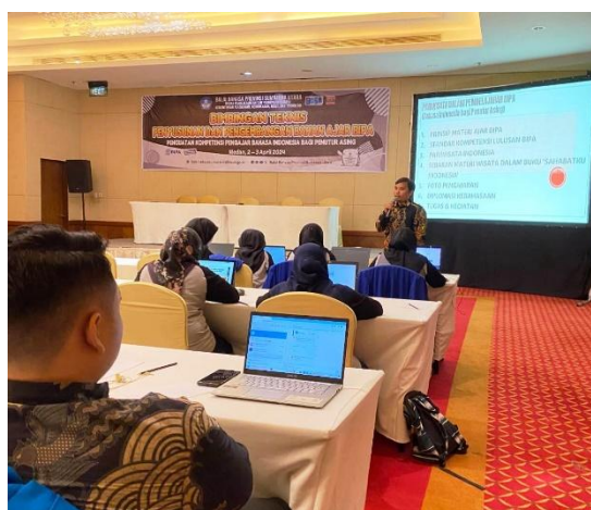
Gambar 2. Kegiatan dalam Pemaparan Materi

Dalam kegiatan ini, penulis menyampaikan bahwa materi BIPA harus didesain berdasarkan kebutuhan dari pemelajar BIPA itu sendiri. Prinsip materi ajar BIPA yang dimaksud terdiri dari: 1) materi yang tepat guna dan fungsional; 2) pendekatan pembelajaran komunikatif dan integratif; 3) pertimbangan level pemelajarnya; 4) pemilihan berdasarkan sudut retensi (kemampuan ingatan); dan 5) visualisasi dalam materi. Berikut ini adalah foto kegiatan dalam pemaparan materi pariwisata dalam pengajaran BIPA;