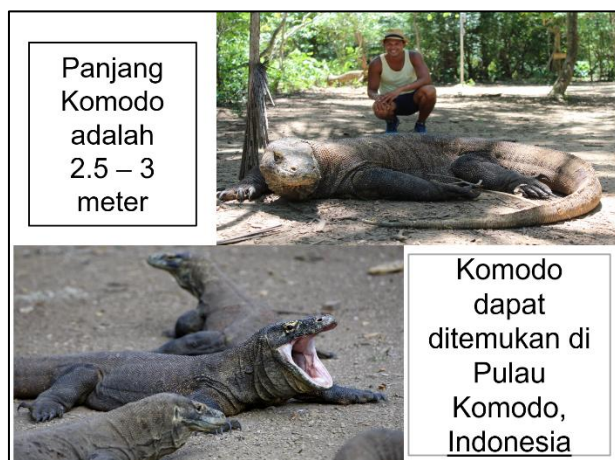
Gambar 3. Ancangan Materi BIPA Tempat Wisata Pulau Komodo

pengembangan materi pariwisata yaitu: pengenalan berbagai budaya Indonesia, tebak gambar, dan pilih kata terkait wisata; 4) Pengembangan materi wisata dapat dilakukan secara variatif dalam berbagai latihan, penugasan, dan informasi tambahan lainnya kepada pemelajar BIPA sesuai level masing-masing. Berikut ini adalah contoh ancangan (draft) materi BIPA dengan tempat pariwisata yang dapat dikembangkan pada empat keterampilan berbahasa.