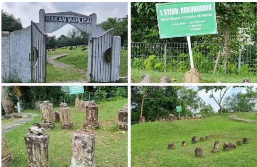
Gambar 3. Contoh Kerja Kelompok (Destinasi Wisata Sumatera Utara)