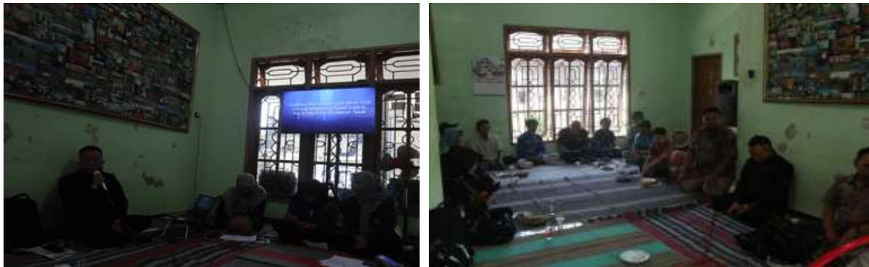
(a) Pemaparan dan Diskusi tentang Alur Pendaftaran Merk Dagang dan Uji Mutu oleh Pemateri; (b) Peserta Mendengarkan Pemaparan dari Pemateri

Kegiatan sosialisasi diakhiri dengan penilaian tingkat pemahaman mitra sasaran dengan mengisi angket dan post test. Peserta juga menyelesaikan post-test dengan mengambil soal-soal pada lembar jawaban.