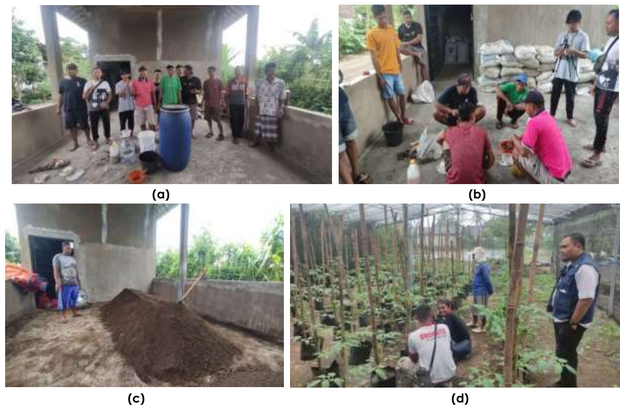
Gambar 1. Aktifitas Taruna Tani (a) Anggota Taruna Tani; (b) Diskusi terkait Pupuk Organik; (c) Pupuk Organik yang Dihasilkan; (d) Ujicoba Pupuk Organik pada Tanaman

organik dalam jangka panjang dan bernilai ekonomis dari pupuk organik yang dihasilkan dimana dapat meningkatkan taraf hidup petani di daerah tersebut.