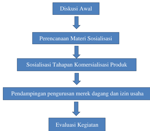
Gambar 2. Tahapan Pelaksanaan Sosialisasi Pendampingan Komersialisasi Produk Pupuk Organik

Tahapan Pelaksanaan Sosialisasi Pendampingan Komersialisasi Produk Pupuk Organik digambarkan pada gambar di bawah