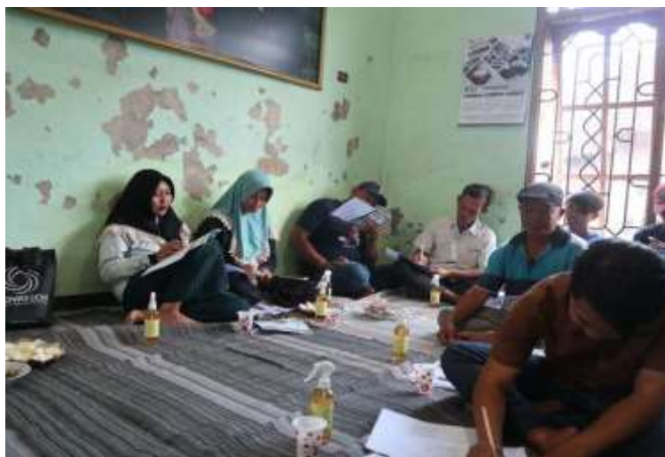
Gambar 3. Kegiatan Pretest yang Dilaksanakan oleh Peserta

Pelaksanaan kegiatan pengabdian masyarakat pada kelompok tani di Desa Jatiguwi Kabupaten Malang dilaksanakan secara luring di salah satu kepala desa setempat pada tanggal 12 Agustus 2023 yang melibatkan beberapa anggota kelompok tani dan masyarakat desa. Sebelum melakukan sosialisasi mengenai tahapan pemasaran produk pupuk, tim pengabdian masyarakat Departemen Teknik Kimia dengan dukungan mahasiswa melakukan uji pendahuluan untuk menilai tingkat pemahaman pengetahuan masyarakat tentang informasi cara pendaftaran izin usaha, merek dagang, dll. Pretest dilakukan dengan cara mengisi soal secara manual, tim membagikan 15 soal kepada peserta kemudian peserta mengerjakannya selama 15 menit. Hal ini dilakukan untuk mengukur pemahaman masyarakat terhadap pemasaran pupuk organik sesuai peraturan yang berlaku.