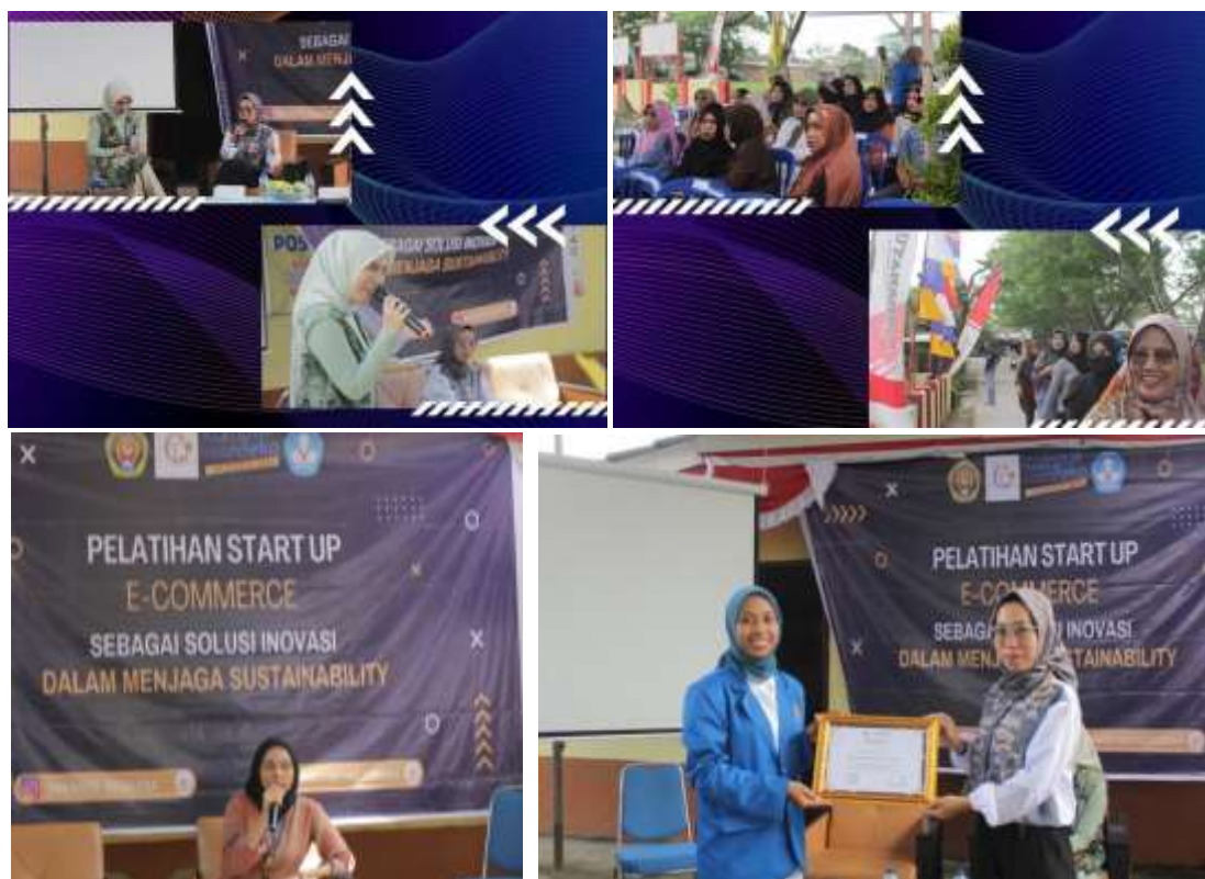
Gambar 3. Pelatihan langsung menggunakan media gawai

situs web e-commerce dengan memasukkan nama pengguna dan kata sandi mereka. Selama proses kegiatan belum ditemukan kendala yang berarti, ibu-ibu PKK saling berinteraksi terkait usaha masing-masing melihat peluang dan tantangan yang akan di hadapi di era digital. Dukungan pengelolaan informasi meliputi pelatihan teknik penulisan informasi untuk dimuat di website mitra dan media sosial, ditulis dengan baik dan bahasa yang menarik untuk meningkatkan kualitas informasi di website (Beriansyah et al., 2021). Gambar kegiatan dapat dilihat di bawah ini.