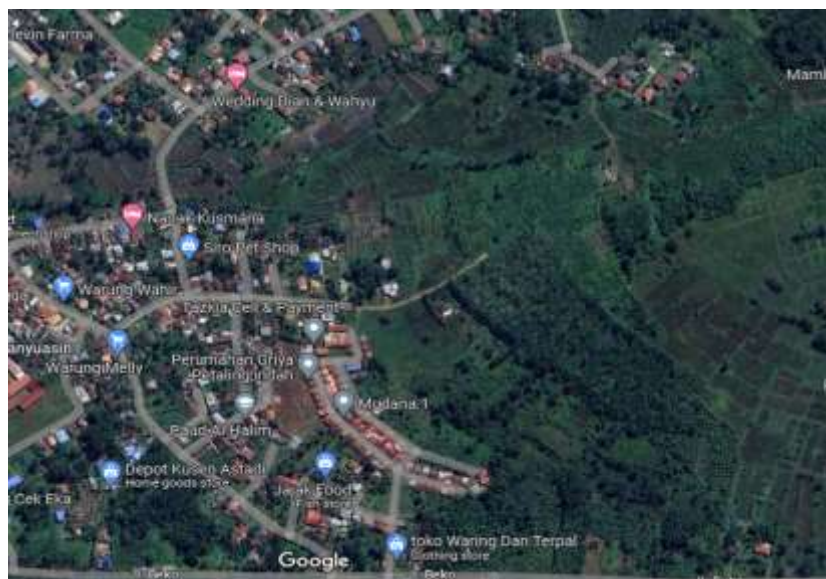
Gambar 2. Lokasi Pengabdian kepada Masyarakat

Rencana kerja tersebut dibuat setelah melakukan pendekatan dan observasi kepada masyarakat setempat. Selanjutnya disusun agenda dengan harapan dapat dilaksanakan dengan baik. Rencana yang merupakan tahap pertama pekerjaan ini disusun dan disesuaikan dengan kondisi, situasi dan permasalahan yang diuraikan pada saat merumuskan permasalahan masyarakat di Kelurahan Mariana, Kecamatan Banyuasin 1. Pengabdian ini dilaksanakan bersama Bapak Lurah Pidianto, S.Sos dan Ibu Dian Rahmawati, A.Md selaku staf marketing media sosial usaha jambu Kristal, usaha jambu Kristal ini berada di atas luas kebun 1,5 hektar, yang beralamatkan sekitar Kelurahan Mariana, Kabupaten Banyuasin Sumatera Selatan jarak tempuh 15 menit dari kantor lurah mariana dengan menggunakan kendaraan sepeda motor. Gambar lokasi dapat dilihat pada gambar di bawah ini.