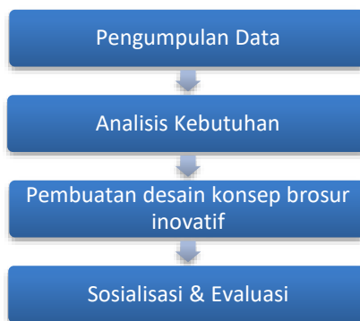
Gambar 1. Tahapan perancangan brosur inovatif museum dr.AK.Gani