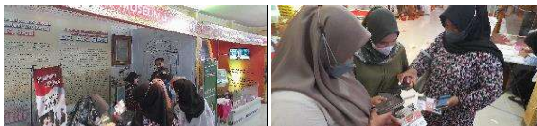
Gambar 5. Pengunjung pameran memanfaatkan brosur inovatif