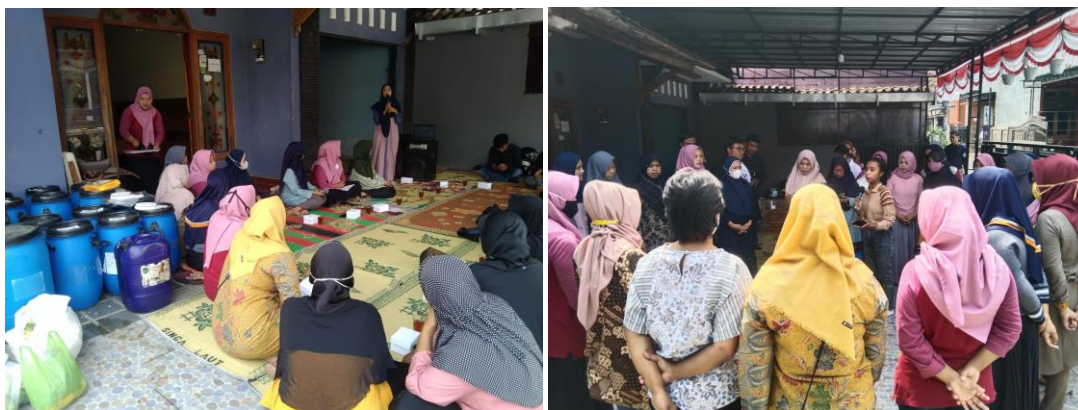
Gambar 1. Diskusi dan Sosialisasi Teknologi Eco-enzyme

Jumlah peserta yang menghadiri kegiatan pelatihan adalah 30 orang. Jumlah tersebut sudah lebih dari 85% dari target peserta kegiatan yang diharapkan. Peserta sangat antusias dengan pemberian materi teknologi eco-enzyme tersebut ditandai dengan banyaknya pertanyaan yang diberikan kepada pemateri. Beberapa pertanyaan yang diajukan peserta, antara lain: limbah-limbah organik yang dapat dibuat eco-enzyme , cara pembuatan eco-enzyme , dan pemanfaatan cairan eco-enzyme . Sebagian besar peserta kegiatan belum mengetahui secara detail mengenai teknologi eco-enzyme dan pemanfaatannya. Kandungan enzyme kompleks, asam-asam organik, dan mineral dalam cairan eco-enzyme sangat efektif untuk berbagai aplikasi. Cairan eco-enzyme dapat digunakan sebagai cairan pembersih, desinfektan, penjernih air, pupuk organik, dan lain-lain (Saifuddin et al., 2021). Adapun sampah organik yang dapat dijadikan eco-enzyme antara lain sisa-sisa sayuran yang belum busuk dan limbah buah-buahan termasuk kulit buah yang tidak keras (Larasati et al., 2020).