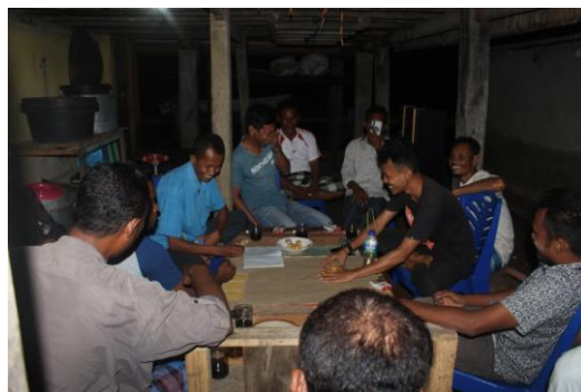
Gambar 2. Pelaksanaan Sosialisasi Kegiatan dan Studi Potensi Desa kepada Masyarakat Desa Komodo

Masyarakat Desa Komodo memerlukan potensi wisata khas yang memang hanya bisa ditemui di Desa Komodo. Potensi wisata ini dapat menjadi daya tarik bagi mereka yang berkunjung ke Taman Nasional Komodo untuk dapat mampir dan menikmati wisata khas Desa Komodo sehingga membentuk sinergi wisata antara Desa Komodo dan Taman Nasional Komodo. Berdasarkan hasil sosialisasi kegiatan, didapatkan dukungan dari perangkat Desa dan masyarakat Desa Komodo, sedangkan untuk Studi Potensi Desa, didapatkan adanya potensi budaya yang dapat dikemas menjadi atraksi wisata. Selain menjangkir masukan terkait potensi wisata alam dan potensi masyarakat Desa Komodo, tahapan ini juga menjangkir harapan masyarakat terkait pengembangan kegiatan kepariwisataan di Desa Komodo.