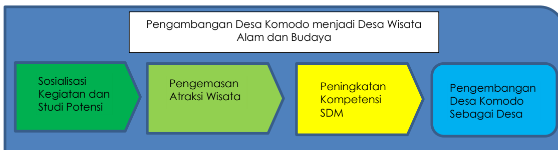
Gambar 1. Alur Pelaksanaan Pengabdian Masyarakat

Dalam melaksanakan pengabdian masyarakat, tim pengabdian mempersiapkan empat (4) Tahapan Pengabdian Masyarakat. Tahapan Pertama adalah Sosialisasi Kegiatan dan Studi Potensi. Tahapan Kedua adalah Pengemasan Atraksi Wisata. Tahapan Ketiga adalah Peningkatan Kompetensi SDM, dan Tahapan Akhir adalah Pengembangan Desa Komodo sebagai Desa Wisata. Berikut ini adalah alur pelaksanaan pengabdian masyarakat.