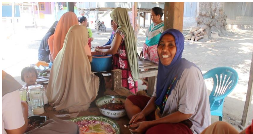
Gambar 3. Ibu-ibu di Desa Komodo berkumpul dan menyanyikan lagu Arugele

Pencak silat adalah seni beladiri bangsa Melayu (Aninsi, 2019). Pencak silat tidak hanya ditemukan di Desa Komodo, namun menurut paparan masyarakat, setiap desa di wilayah Taman Nasional Komodo memiliki kesenian silat. Kesenian ini lahir dari berbagai konflik antar masyarakat pada zaman dulu, sehingga kelompok-kelompok masyarakat berusaha melindungi diri dengan keterampilan bela diri. Dalam perkembangannya kini, seni beladiri ini berubah fungsinya menjadi atraksi kesenian untuk wisatawan.