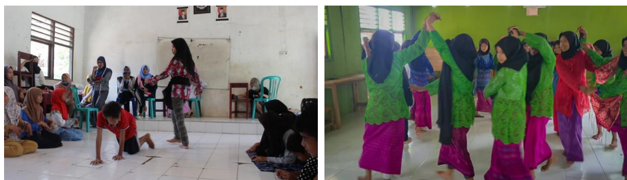
(a) (b) Gambar 5. Atraksi Tari Komodo saat Latihan (a), dan saat gladi bersih (b) yang terdiri atas 3 babak penceritaan

Pengemasan Tari Komodo juga merupakan bentuk dukungan kepada kehidupan masyarakat Desa Komodo karena kehidupan mereka tidak dapat lepas dari hewan komodo dan habitatnya. Bahkan ada keyakinan bahwa baik hewan komodo maupun masyarakat Desa komodo tidak dapat dipisahkan. Oleh sebab itu, dalam pandangan masyarakat Desa Komodo, anggapan bahwa keberadaan masyarakat komodo itu akan mengganggu hewan komodo dan habitat komodo adalah pandangan yang keliru. Bukti lain bahwa hewan komodo dan masyarakat Desa Komodo hidup secara harmonis terlihat melalui belum pernah terjadi konflik antara komodo dan masyarakat. Maka bisa dikatakan apabila mitos ini menjadi bagian penting dari atraksi wisata di Taman Nasional Komodo. Selain mengagas Tari Komodo, Tim Pengabdian Masyarakat ini juga mendampingi masyarakat Desa Komodo khususnya yang bekerja di industri pariwisata untuk mampu mengemas potensi wisata Desa Komodo dalam paket-paket wisata yang mampu ditawarkan kepada wisatawan yang berkunjung ke Taman Nasional Komodo dan Desa Komodo.