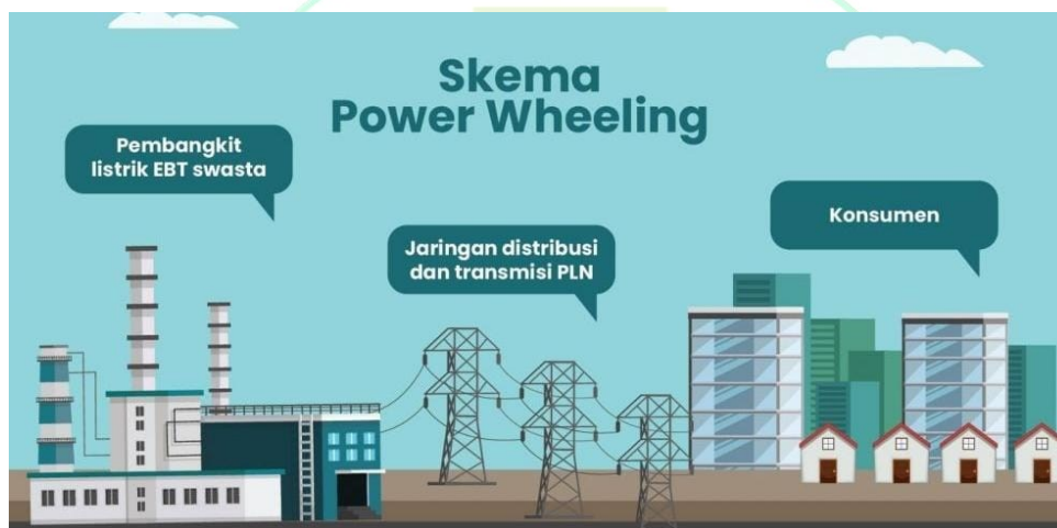
Gambar 1.2 Skema Power Wheeling

Konsep Power Wheeling adalah pemanfaatan bersama jaringan tenaga listrik melalui jaringan transmisi dan distribusi listrik akses terbuka, dimana hal ini merupakan mekanisme yang dapat memudahkan transfer energi listrik dari sumber energi terbarukan atau pembangkit swasta ke fasilitas operasi PLN secara langsung. Pendekatan ini memungkinkan pengguna untuk membeli listrik dari sumber selain generator di tempat mereka sendiri. Power wheeling memungkinkan pelanggan listrik, misalnya industri, untuk membeli listrik dari pembangkit swasta yang berada di luar wilayahnya. Oleh karena itu memungkinkan adanya diversifikasi sumber listrik kepada pelanggan karena pelanggan dapat memilih pemasok listriknya sendiri.