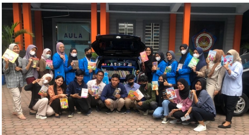
Gambar 11. Mobil Almira Library Bersama Mahasiswa/i Fisip UMSU dan FEB UND HAR

penyempurnaan TA (Tugas Akhir) mata kuliah Desain Produksi Siaran Televisi & Radio dengan tema “ Feature ”.