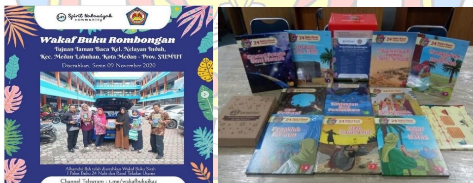
Gambar 5 Wakaf Buku Sirah, 1 Paket 24 Nabi dan Rasul Teladan Utama - SNC

SNC sebuah komunitas yang berfokus pada pendidikan dan pengetahuan bagi anak-anak untuk lebih mengenal sejarah islami, seperti Sirah atau sejarah nabi dan rasul. SNC bersama almira library ikut berpartisipasi dalam kegiatan memberantas buta sirah, buta aksara, dan meningkatkan minat baca dan melengkungkan senyum anak-anak yang sejatinya suka membaca, dan memberikan nutrisi rohani yang baik bagi anak-anak di seluruh pelosok negeri. merupakan