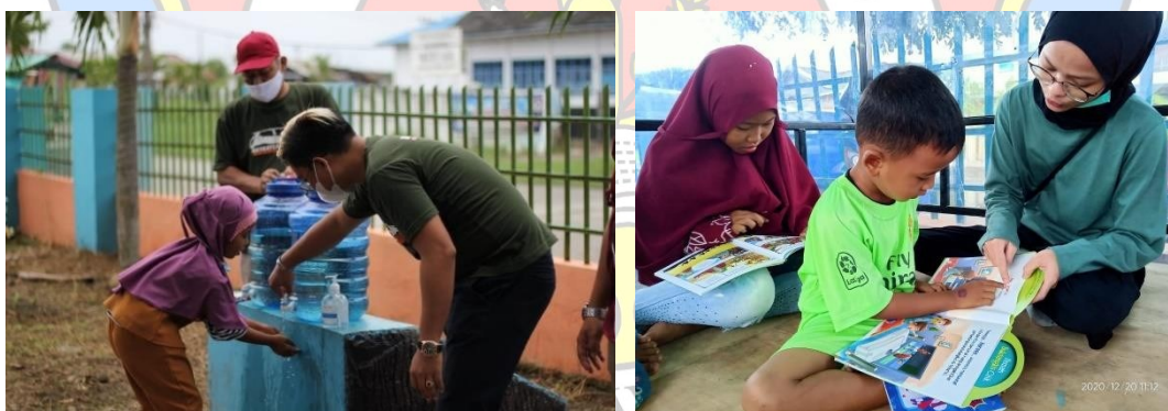
Gambar 2 Sosialisasikan Gerakan 3M dan Belajar Sembari Bermain

Agya Ayla Squad merupakan salah satu komunitas otomotif di Kota Medan yang beranggotakan pemilik kendaraan dengan merk Toyota Agya dan Daihatsu Ayla di Kota Medan yang memiliki program kerja di bidang pendidikan, kesehatan dan sosial kemasyarakatan. Mobil almira library merupakan salah satu member Agya AylaSquad berimage perpustakaan keliling. Setiap kunjungan literasinya, mobil almira library selalu melibatkan Agya Ayla Squad.