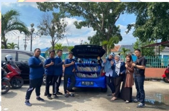
Gambar 1 Almira Library Bersama Rekan Dosen dan Mahasiswa

Almira Library adalah city car warna biru yang dimodifikasi dan memiliki konsep perpustakaan keliling oleh AF yang berprofesi sebagai dosen di Fakultas Ekonomi Dan Bisnis Universitas Dharmawangsa dan tergabung dalam komunitas Agya Ayla Squad. Mobil tidak hanya berfungsi sebagai transportasi antar jemput, tetapi mobil juga dapat dimodifikasi sebagai media edukasi perpustakaan keliling, bagian belakang mobil dimodifikasi menjadi rak buku yang disesuaikan dengan interior dan eksteriornya, sehingga terlihat good looking saat kunjungan literasi.