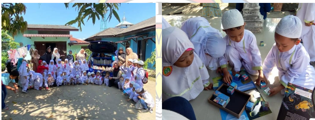
Gambar 6. Keseruan Games Edukatif

Minimnya jumlah dan varian buku bacaan anak-anak di PAUD Alkindy Islamic School, terkadang muncul rasa bosan saat kegiatan belajar mengajar, sehingga para guru cukup kewalahan menemukan solusi dan strategi baru untuk meningkatkan semangat belajar mereka.