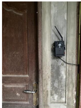
Gambar 3.1 Implementasi fisik perangkat keras pada area pintu masuk.

Implementasi sistem dilakukan dengan mengintegrasikan ESP32-CAM sebagai mikrokontroler utama yang mengelola modul kamera OV2640, sensor PIR, dan modul audio DFPlayer Mini. Perangkat dikemas dalam sebuah enclosure khusus dan dipasang pada pintu masuk dengan ketinggian 1,5 meter untuk mendapatkan sudut pandang (Field of View) kamera yang optimal. Pengujian dilakukan pada lingkungan jaringan Wi-Fi lokal dengan kekuatan sinyal rata-rata -60 dBm hingga -70 dBm.