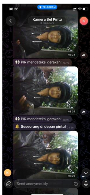
Gambar 3.2 Verifikasi pengiriman pesan teks dan citra tamu secara real-time pada bot Telegram.

Berdasarkan data di atas, sistem bekerja optimal pada jarak di bawah 6 meter. Kegagalan pada jarak 7 meter disebabkan oleh limitasi jangkauan fisik sensor HC-SR501 dalam mendeteksi radiasi inframerah. Kecepatan pengiriman foto ke Telegram yang berkisar antara 2 hingga 3 detik menunjukkan performa transmisi data yang stabil, di mana ukuran file gambar .jpg dari kamera OV2640 berhasil dikirimkan melalui protokol HTTPS tanpa kendala timeout.