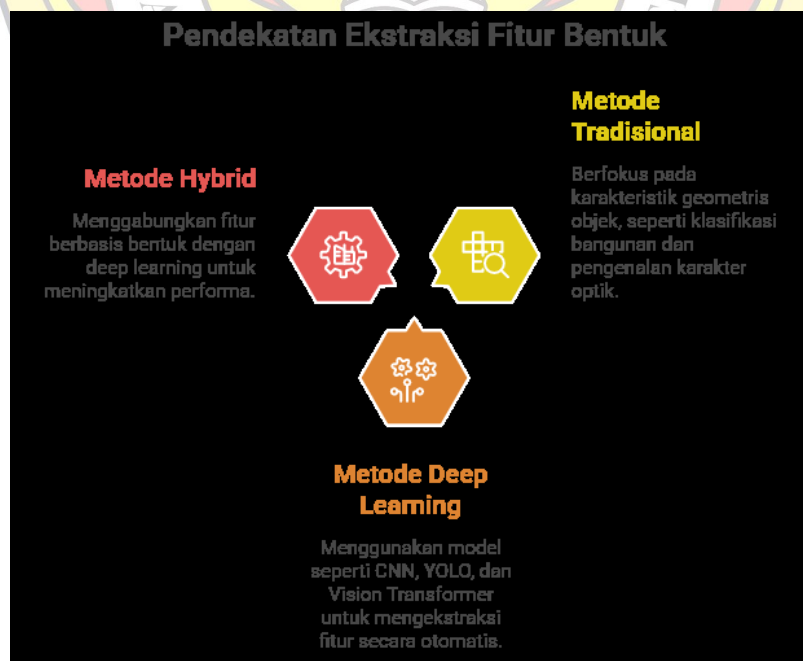
Gambar 2 Klasifikasi Pendekatan dalam Ekstraksi Fitur Berbasis Bentuk

Berdasarkan 22 paper yang dianalisis, metode dalam shape-based feature extraction dapat diklasifikasikan ke dalam tiga pendekatan utama, yaitu metode berbasis fitur bentuk tradisional, metode berbasis deep learning, dan metode hybrid. Pendekatan tradisional masih digunakan dalam beberapa penelitian yang menekankan representasi geometris objek secara eksplisit, seperti pada klasifikasi berbasis bentuk dan pengenalan karakter optik yang memanfaatkan struktur kontur dan relasi spasial (Sulzer et al., 2018; Nizamani et al., 2019; Poux & Ponciano, 2020; Zhang et al., 2023). Selain itu, pendekatan berbasis descriptor seperti orientasi pola dan ekstraksi fitur manual juga masih digunakan untuk mempertahankan interpretabilitas fitur (Alsabhan et al., 2022; Deepa et al., 2022; Mohan & Kurian, 2022).