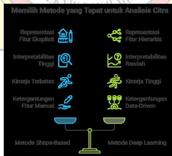
Gambar 4 Perbandingan Metode Shape-Based dan Deep Learning dalam Analisis Citra

Perbandingan ini menunjukkan adanya trade-off antara interpretabilitas dan performa. Oleh karena itu, penelitian terkini cenderung mengarah pada pendekatan hybrid yang menggabungkan keunggulan kedua metode untuk menghasilkan sistem yang lebih optimal (Malu et al., 2024).